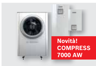
326 Pompe di calore