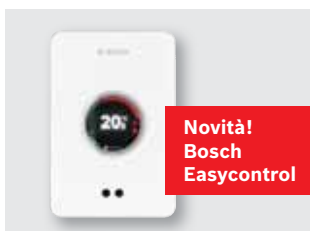
293 Sistemi di controllo