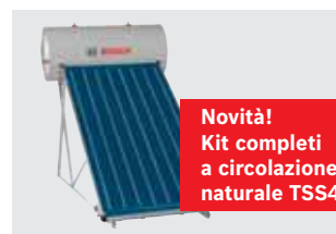
360 Circolazione naturale