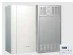
128 Caldaie da esterno e da incasso