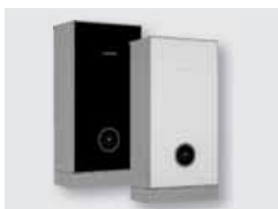
250 Scalda acqua a gas per applicazioni monofamiliari