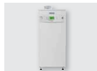
140 Caldaie a basamento