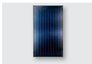
356 Solare Termico