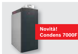
182 Caldaie a basamento