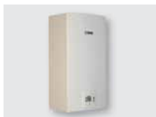
264 Scalda acqua a gas alta portata