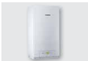
164 Caldaie murali