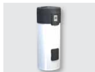
270 Scalda acqua in pompa di calore