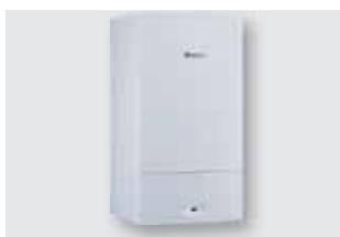
150 Caldaie convenzionali