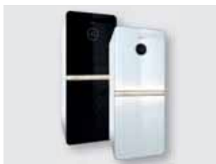
72 Sistemi integrati