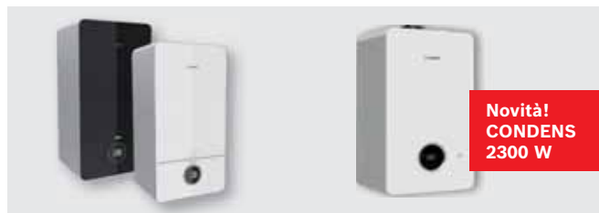
96 Caldaie murali