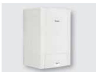
120 Caldaie con accumulo ACS